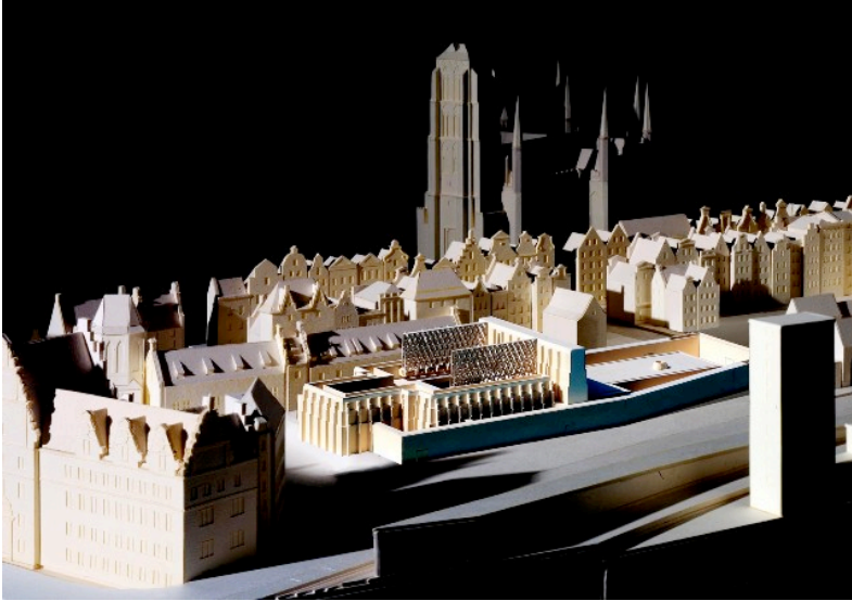
Bilder av modellen av det nye Shakespeare-teatret i Gdansk